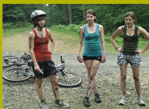
VTT Raid Nature